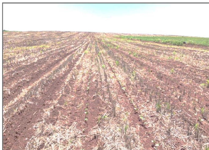
Cambará - Cenizo